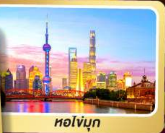
หอไข่มุก