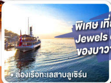
ล่องเรือทะเลสาบลูเซิร์น

พิเศษ เกี่ยวครบเส้นทาง Jewels of Romantic Europe ของบาวาเรียและทิโรล