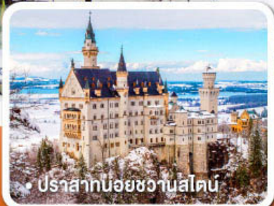
ปราสาทน้อยชวานสไตน์