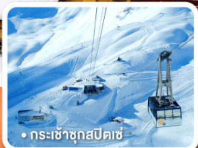
กระเช้าชุกสปีตเซ