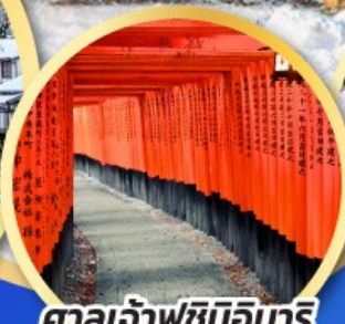
ศาลเจ้าฟุชิมิอินาริ