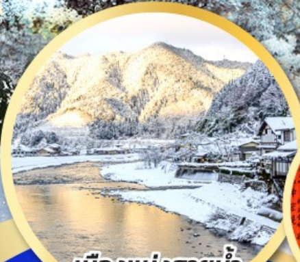
เมืองแห่งสายน้ำ กุโจะจิมัง