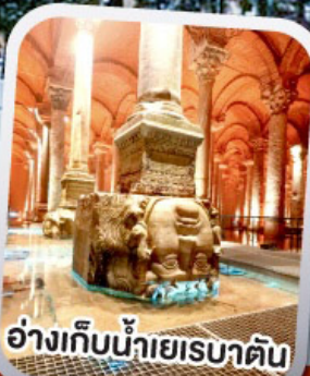
อ่างเก็บน้ำเยเรบาตัน