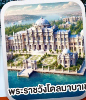
พระราชวังโดลมาบาเซ่