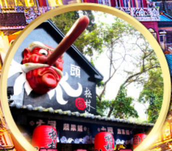
หมู่บ้านปศาจชิโก