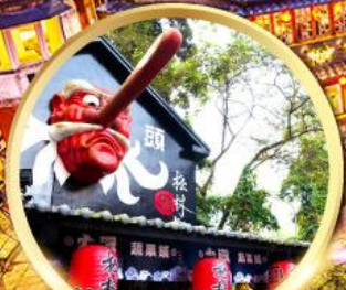
หมู่บ้านปศาจซีโกว