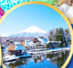
หมู่บ้านน้ำใส ไอชิโนะอัทสึ