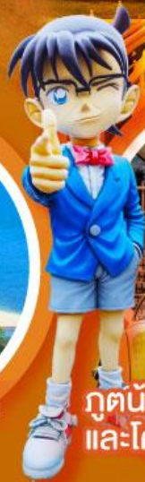
กูดน้อย คิตาโร่ และโคนัน