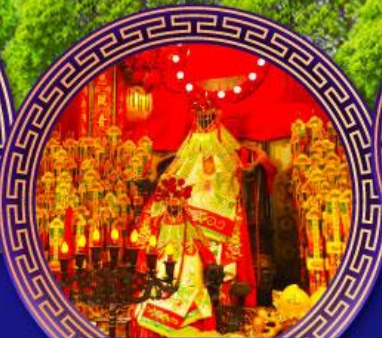
วัดเจ้าแม่กวนอิม ฮองฮ่า