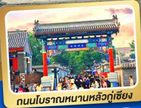
ถนนโบราณหนานหลิวกู่เซียง