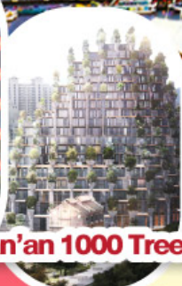
Tian'an 1000 Trees