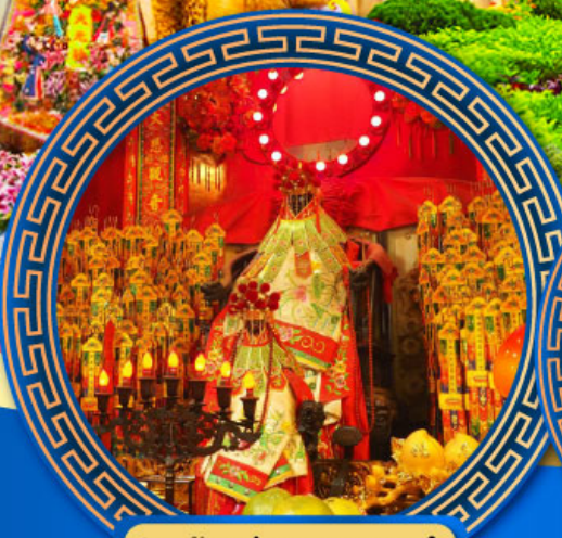
วัดเจ้าแม่กวนอิมสองห้า