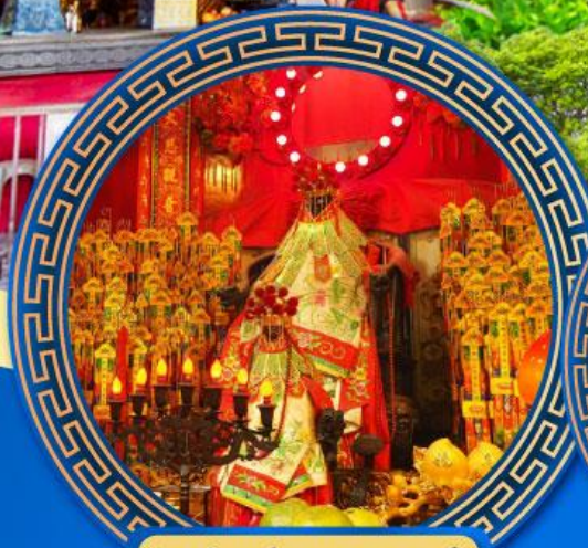
วัดเจ้าแม่กวนอิมสองห้า