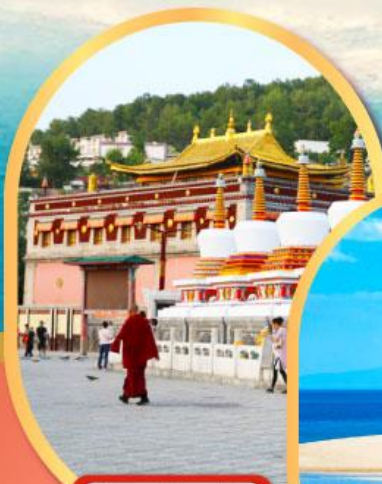
วัดท่าอ้อ