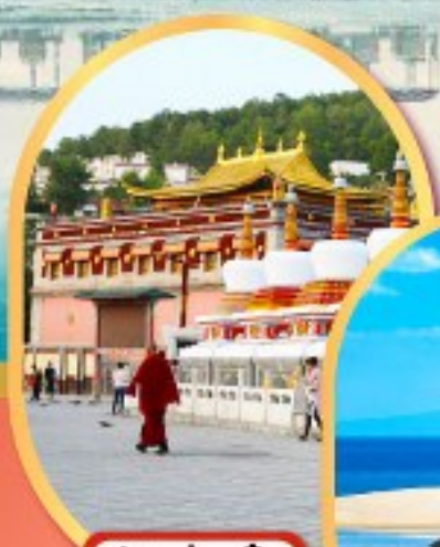
วัดต้าอ๋อ