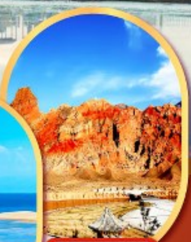
หุบเขาห้าสี อุทยานธรณีกุยเต๋อ