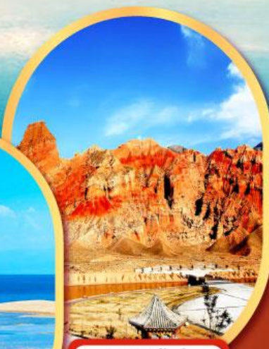
หุบเขาห้าสี อุทยานธรณีกุ้ยเต๋อ