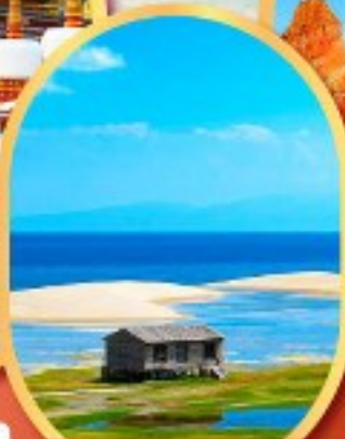
ทะเลสาบชิงไห่