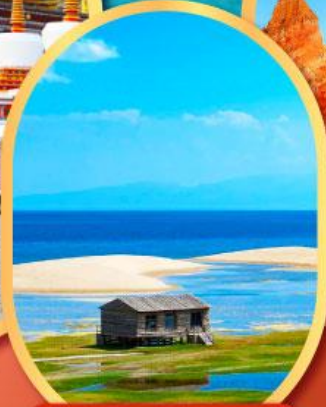
ทะเลสาบชิงไห่