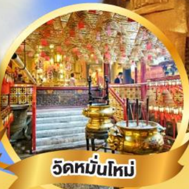
วัดมื่นใหม่