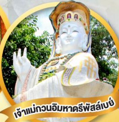
เจ้าแม่กวนอิมหาคีรีพิสัย