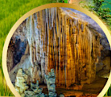
น้ำสวรรค์