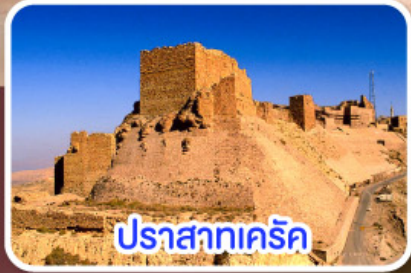
ปราสาทครีค