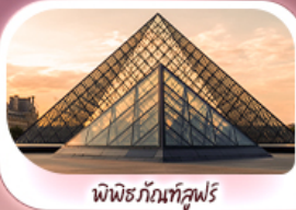
พีพริกันท์ลูฟร์