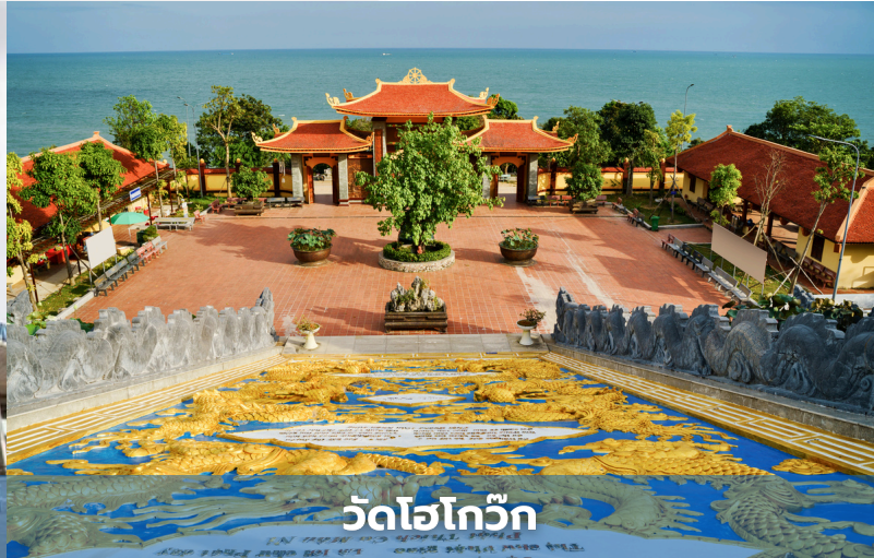
วัดโฮโก๊วก