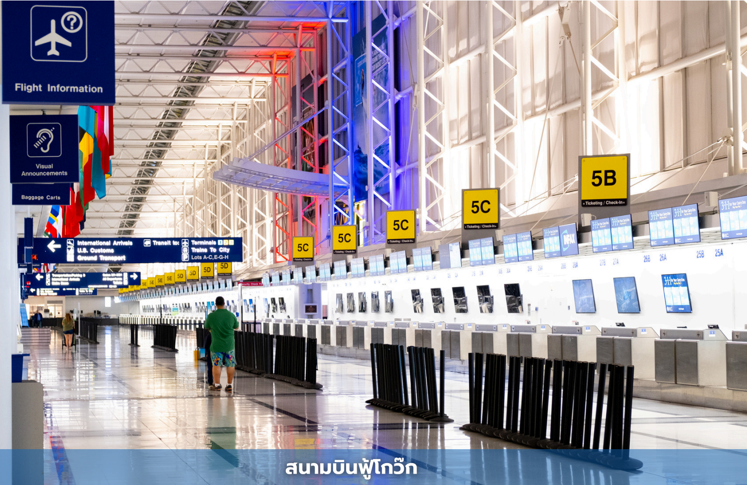
สนามบินฟูโก๊วก