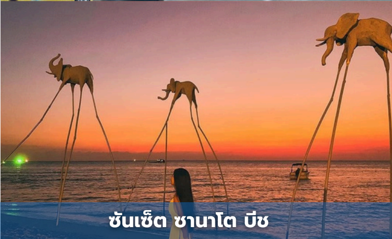
ซันเซต ซานาโต บีช