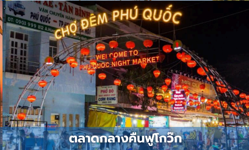
ตลาดกลางคืนฟูโก๊วก