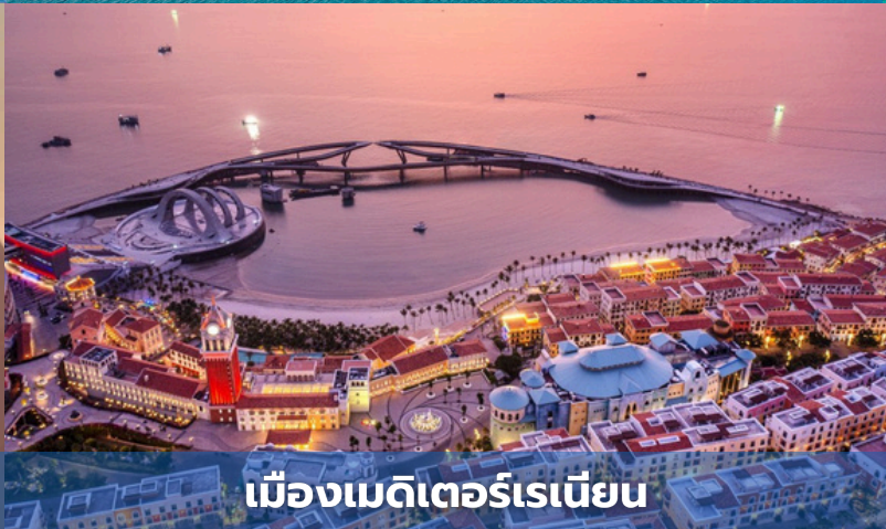
เมืองเมดิเตอร์เรเนียน