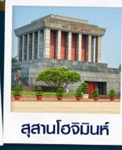
สุสานโฮจิมินห์