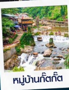
หมู่บ้านก๊ตก๊ต