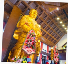
วัดแซกกงหมิว