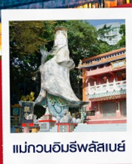
แม่กวนอิมรัพลัสเบย์