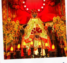
เจ้าแม่กวณอิรมองฮ่า