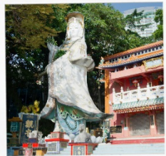
แม่กวณอิรมรลลลลลลล