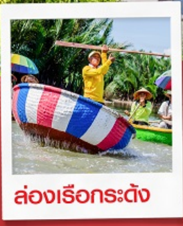
ล่องเรือกระดิ่ง