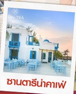
ซานตารีน่าคาเฟ่