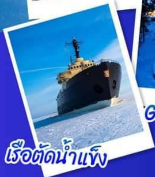
เรือตัดน้ำแข็ง