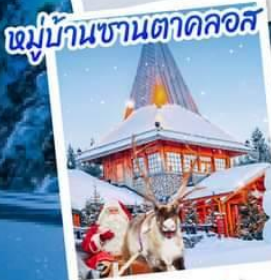
หมู่บ้านซานตาคลอส