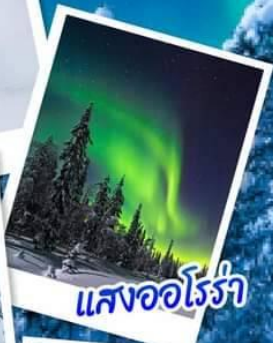
แสงออโรรา