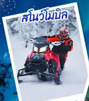
สโนว์โมบิล