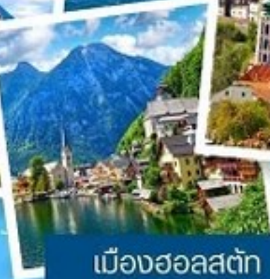
เมืองฮอลสตัด