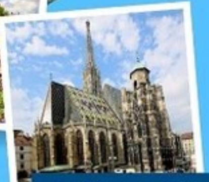
มหาวิหารแมททีอัส

เยอรมนี ออสเตรีย เชก สโลวาเกีย ฮังการี 9 วัน