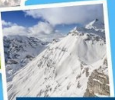
ยอดเขาซิลรอร์น