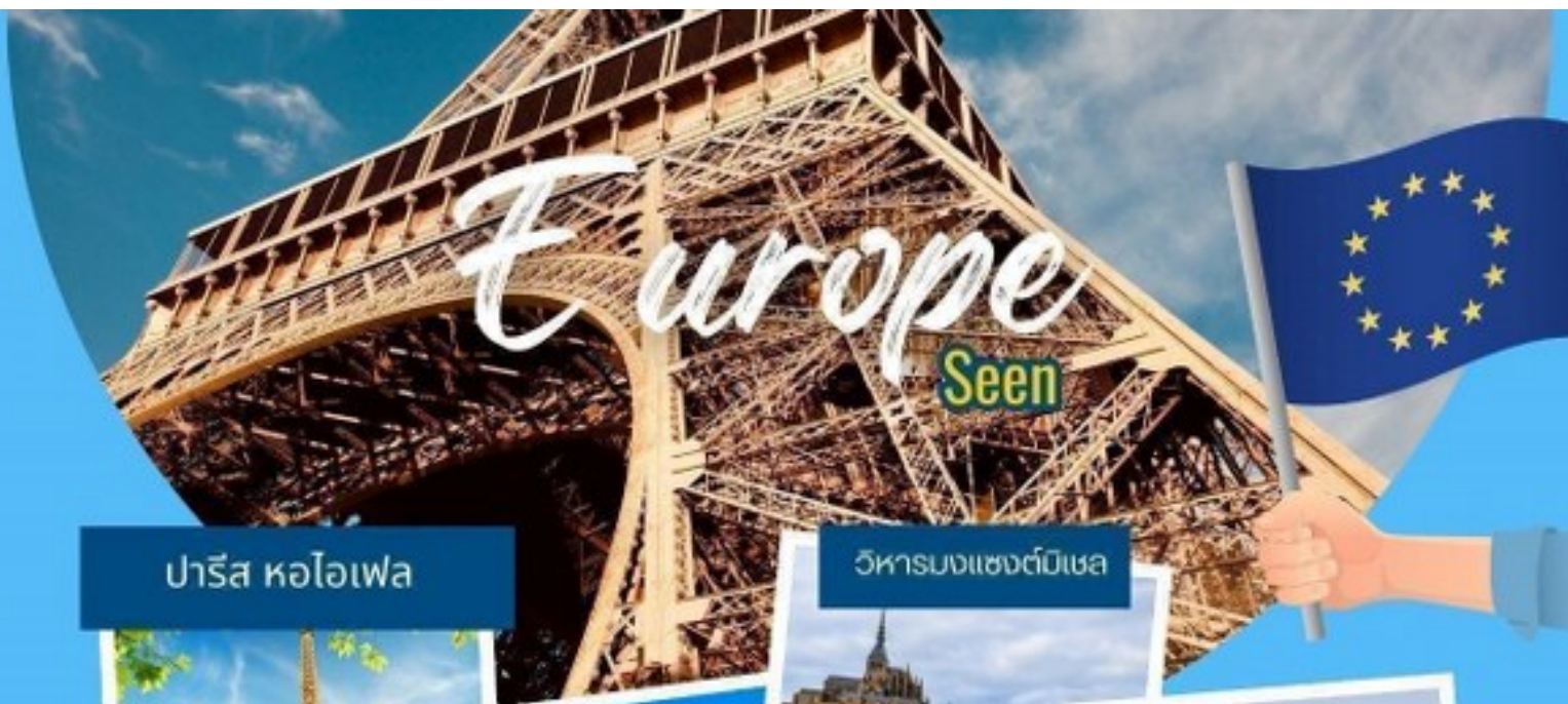
ปารีส หอไอเฟล

U.TRAVEL VACATIONS. license : 11/07022 12/4 Soi Suksawasdi 15/1, Suksawasdi Road, Bangpakok, Rasburana, Bangkok 10140 Thailand Tel. 02-428 2114 Fax. 02-428 2125 Email : u.travel@hotmail.com Website ; http://www.utravel.in.th