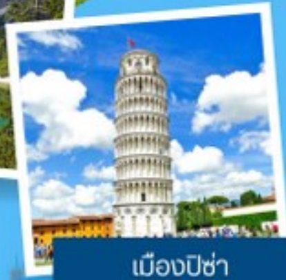
เมืองปิซ่า

อาณาจักรโรมัน อิตาลี เหนือ-ใต้ 12 วัน 9 คืน