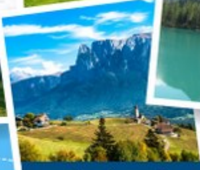
เมืองโบลซาโน