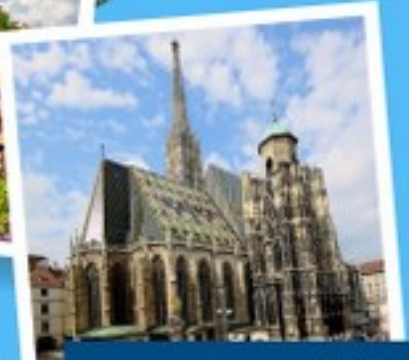
มหาวิหารแมททีอัส

เยอรมนี ออสเตรีย เชก สโลวาเกีย ฮังการี 11 วัน 8 คืน