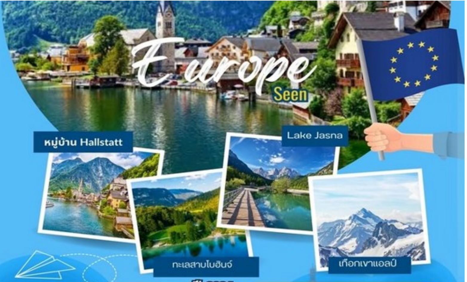
หมู่บ้าน Hallstatt

U. TRAVEL VACATIONS. license : 11/07022 12/4 Soi Suksawasdi 15/1, Suksawasdi Road, Bangpakok, Rasburana, Bangkok 10140 Thailand Tel. 02-428 2114 Fax. 02-428 2125 Email : u.travel@hotmail.com Website ; http://www.utravel.in.th