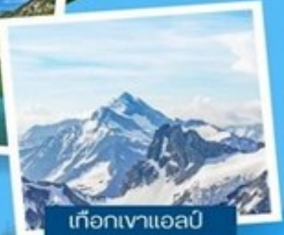
เทือกเขาแอลป์