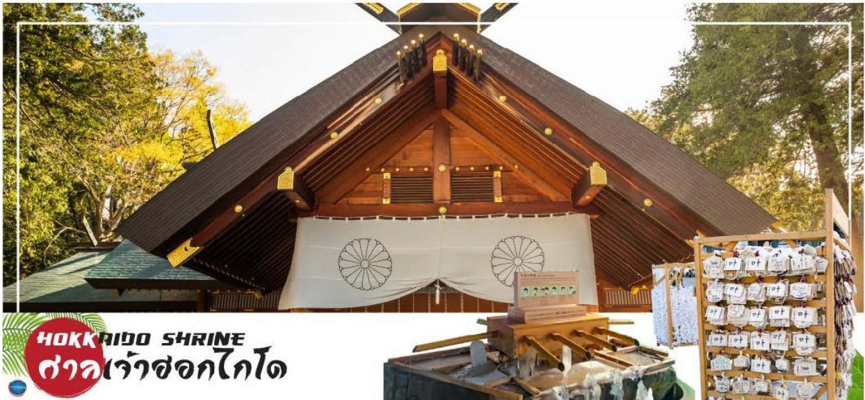
HOKKAIDO SHRINE ศาลเจ้าฮอกไกโด

นำท่านเดินทางสู่ เมืองซัปโปโร (SAPPORO) (ใช้เวลาเดินทางประมาณ 2.30 ชั่วโมง) นำท่านขอพร ศาลเจ้าฮอกไกโด (Hokkaido Shrine) หรือเดิมชื่อ ศาลเจ้าซัปโปโร เปลี่ยนเพื่อให้สมกับ ความยิ่งใหญ่ของเกาะเมืองฮอกไกโด ศาลเจ้าชินโตนี้คอยปกป้องรักษา ให้ชนชาวเกาะฮอกไกโดมีความสุขถึงแม้จะไม่ได้มีประวัติศาสตร์อันยาวนาน นำท่านเดินทางสู่ ย่านซุซุกิโนะ (Susukino) นับเป็นย่านที่เต็มไปด้วยแหล่งบันเทิงที่โด่งดังมากที่สุดของเมืองซัปโปโร(Sapporo) อีกทั้งยังเรียกได้ว่าเป็นย่านบันเทิงที่ใหญ่ที่สุดในทางตอนเหนือของญี่ปุ่นทีเดียวล่ะค่ะ บอกเลยว่าอยากมาบันเทิงใจยามค่ำคืนสัมผัสไลฟ์สไตล์แบบคนญี่ปุ่นแท้ๆ ต้องมาที่นี่ให้ได้เลยล่ะค่ะ เพราะเต็มไปด้วยร้านค้า บาร์ ร้านอาหาร ร้านคาราโอเกะ และตู้ปาลังโกะรวมกว่า 4,000 ร้าน บางร้านนี้เปิดจนถึงเที่ยงเที่ยงคืน