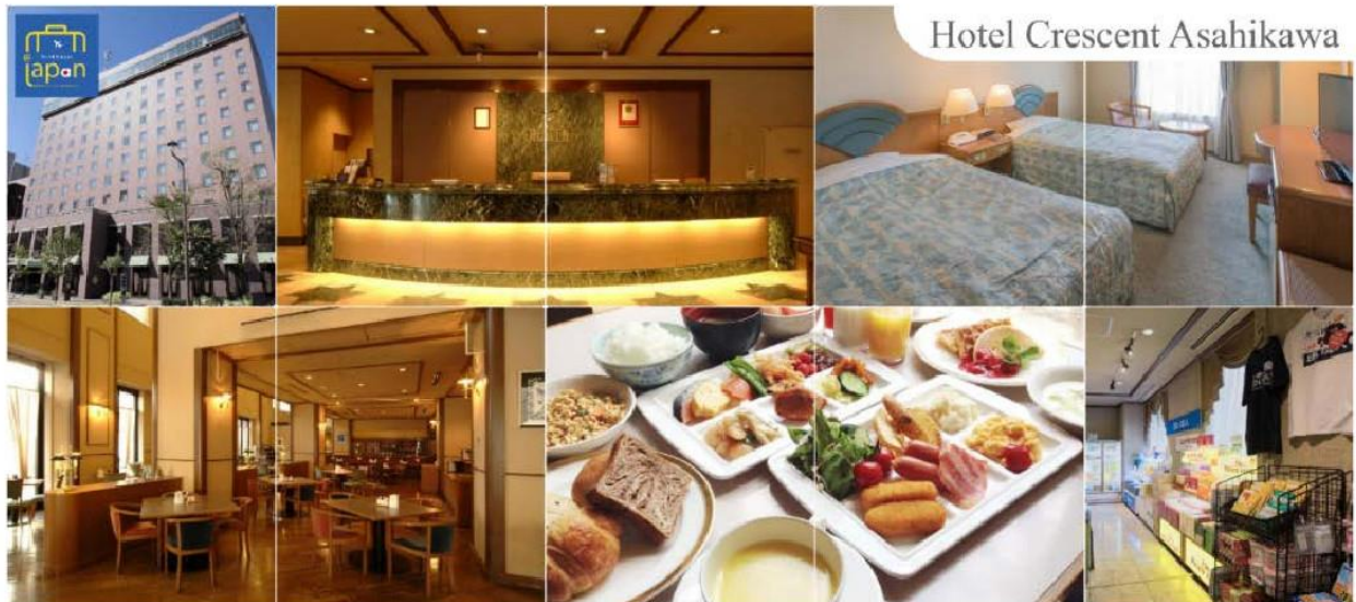
Hotel Crescent Asahikawa

คำ อีสระรับประทานอาหารค่ำตามอัธยาศัย ที่พัก HOTEL CRESCENT ASAHI KAWA หรือเทียบเท่า