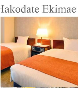
Hotel Flexstay Hakodate Ekimae