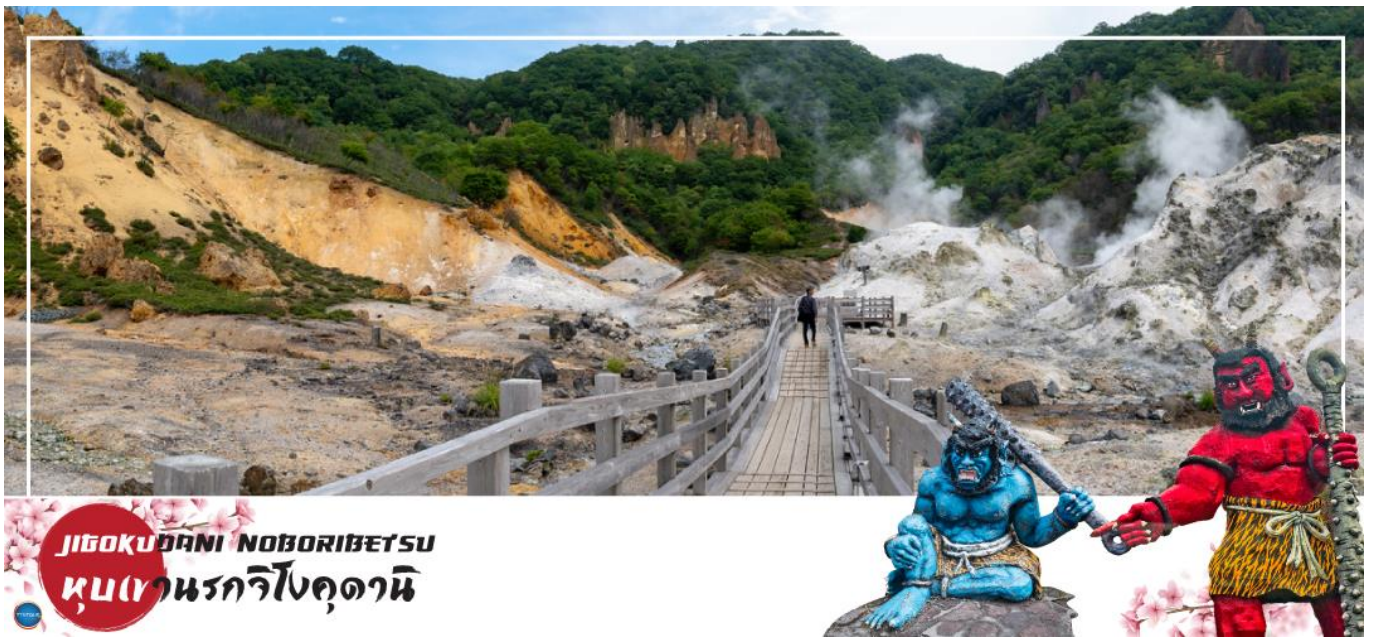
JIGOKUDANI NOBORIBETSU หุบเขานรกจิโกกุดานิ

02.05 น. ออกเดินทางสู่ ท่าอากาศยานนิวซีโดเสะ เกาะฮอกไกโด ณ ประเทศญี่ปุ่น เที่ยวบินที่ XJ620 (บริการอาหารร้อน พร้อมเครื่องดื่ม บนเครื่อง)