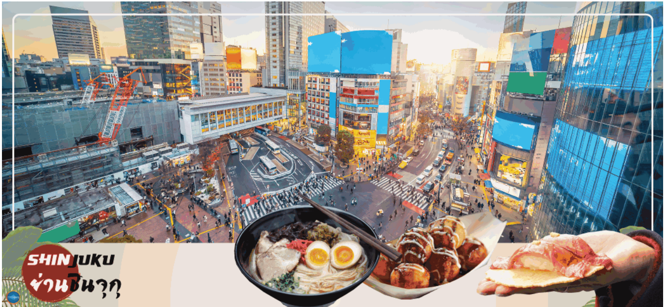
SHINJUKU ย่านชินจุกุ