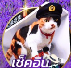
เช็คอิน แมวยักษ์ 3 มิติ