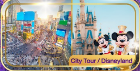
City Tour / Disneyland