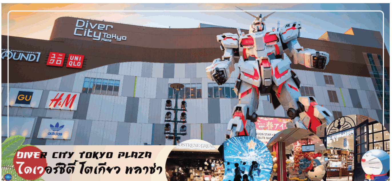
DIVER CITY TOKYO PLAZA ไดเวอร์ซิตี โตเกียว พลาซ่า

แต่ก็ยังคงความเป็นธรรมชาติไว้ด้วยความอุดมสมบูรณ์ของพื้นที่สีเขียว ไดเวอร์ซิตี โตเกียว พลาซ่า (Diver City Tokyo Plaza) เป็นห้างดังอีกห้างหนึ่ง ที่อยู่บนเกาะ โอไดบะ จุดเด่นของห้างนี้ก็คือ