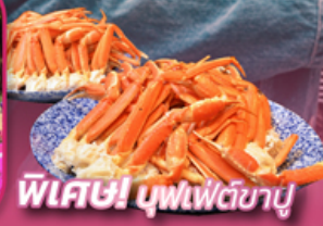
พิเศษ! นูฟฟูเดี่ยปู