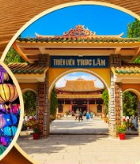
วัดตักลัม