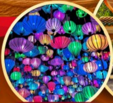
สวนแห่งแสง (Lumiere Light Garden)