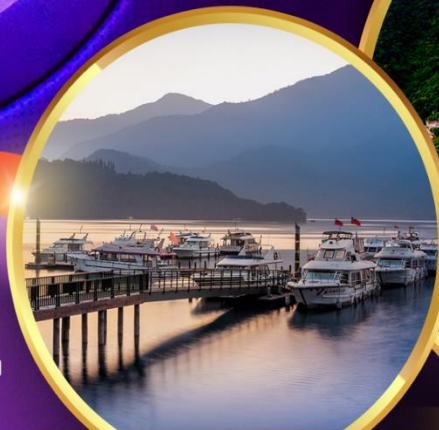
ล่องเรือทะเลสาบสุริยันจันทรา