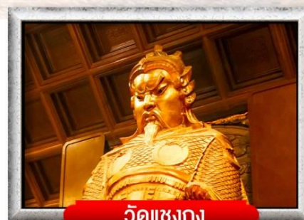
วัดแชงกง