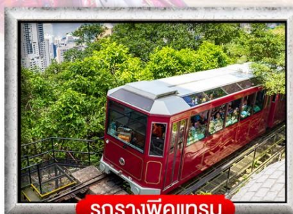
รถรางพิกแตรม