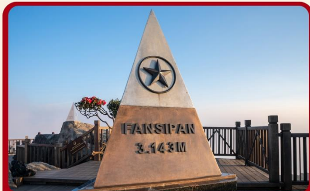
นั่งกระเช้าสู่ยอดเขาฟานซิปัน