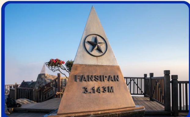
น้ิงกระเช้าสู่ยอดเขาฟานซิปัน