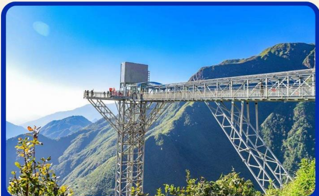
สะพานแก้วมังกรเมฆ (Rong May Glass Bridge)