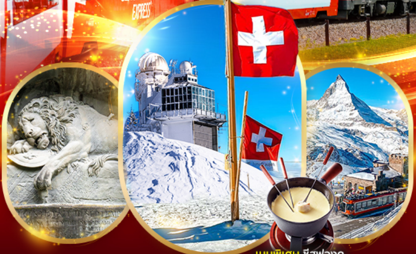
เมนูพิเศษ ชีสฟองดู

เดินทาง 20 - 27 กันยายน 67 / 9 - 16 ตุลาคม 67