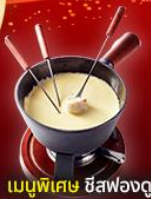
เมนูพิเศษ ชีสฟองดู

2 ยอดเขาที่สวยงามที่สุด Jungfrau และ Matterhorn รวมตั๋วรถไฟ Glacier Express และ Gornergrat train เมืองมองเทรอ ปราสาทซิลยออง เวเวย์ รูปีนชาร์ลี แซปลิน โลซาน ศาลาไทย เบิร์น ลูเซิร์น สะพานไม้ซาเปล ลิงโตสะอัน ทะเลสาบสิมรกต เบลาเช