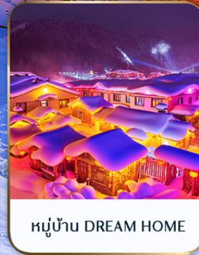
หมู่บ้าน DREAM HOME