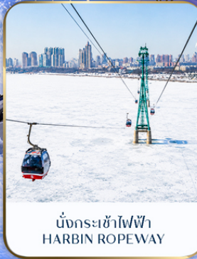
นั่งกระเช้าไฟฟ้า HARBIN ROPEWAY