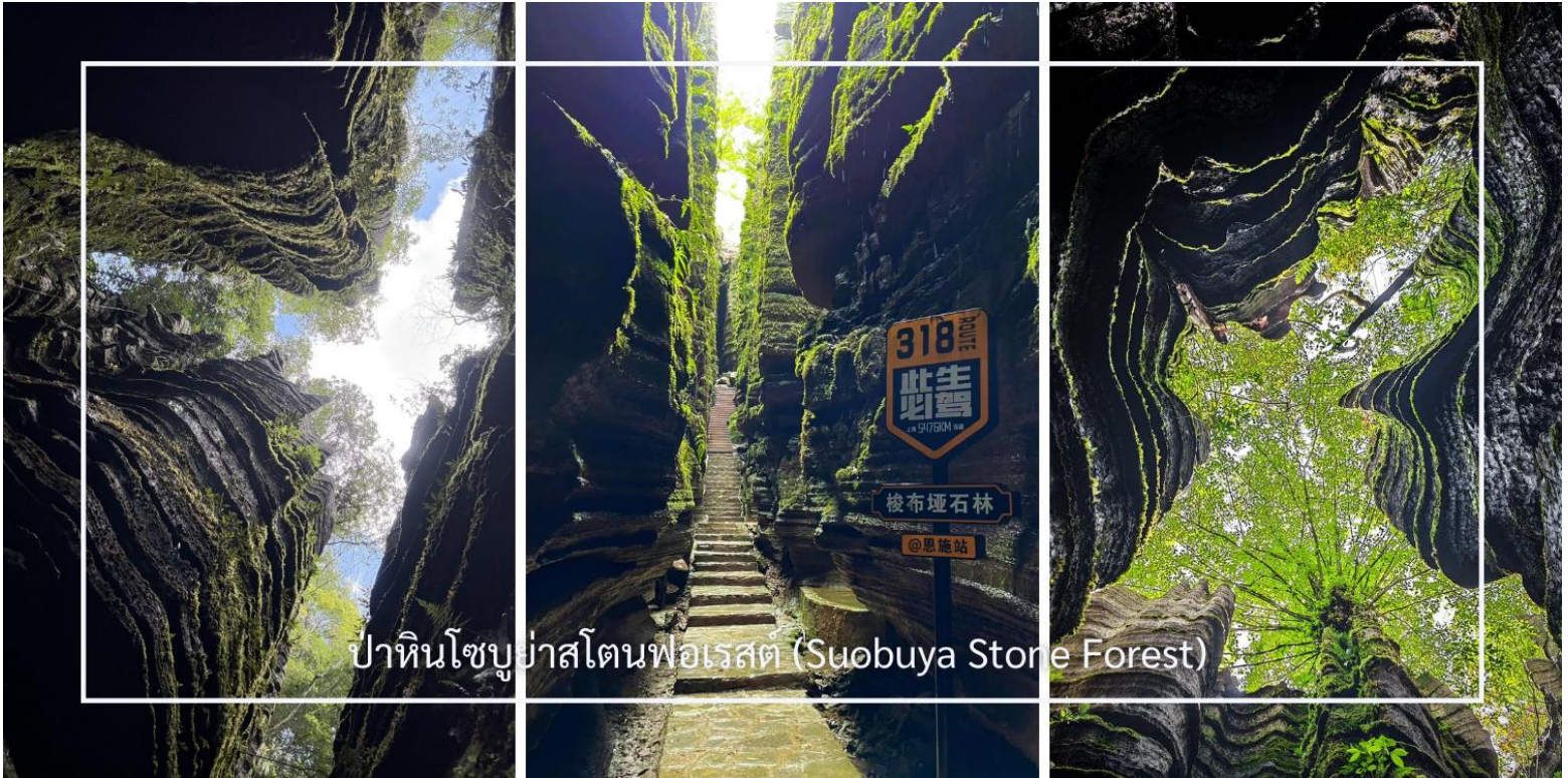
ป่าหินโซบูย่าสโตนฟอเรสต์ (Suobuya Stone Forest)

หลังอาหารเช้านำท่านสู่ ป่าหินโซบูย่าสโตนฟอเรสต์ (Suobuya Stone Forest) แหล่งท่องเที่ยวทางธรรมชาติอันน่ามหัศจรรย์ ซึ่งโดดเด่นด้วยกลุ่มหินปูนรูปร่างแปลกตาที่ก่อตัวขึ้นตามธรรมชาติเป็นเวลานานนับล้านปี ภายในพื้นที่เต็มไปด้วยเสาหินสูงตระหง่านเรียงรายสลับซับซ้อน เปรียบเสมือนป่าที่สร้างขึ้นจากหิน ผสานกับบรรยากาศร่มรื่นและเงียบสงบ เหมาะแก่การเดินชมธรรมชาติและเก็บภาพความประทับใจตลอดเส้นทาง