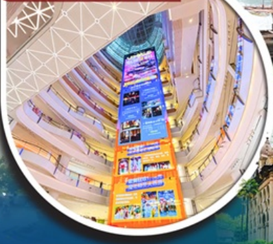
Wushang Dream Plaza Mall

✈️ คอมพิวเตอร์ออกเดินทาง ตั้งแต่ 10 ท่าน ขึ้นไป