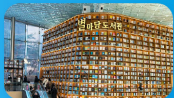
ต้องสมุดสตาร์ฟิลา