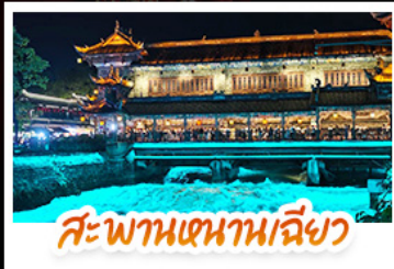
สะพานเทียนเฉียว