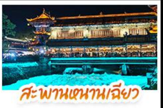
สะพานเทียนเหมินเฉียว