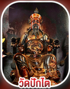
วัดบิกโต