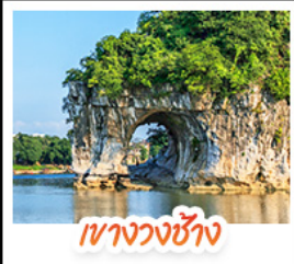
เวางวงซ้าง