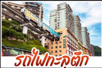
รถไฟฟ้าเซี่ยงไฮ้