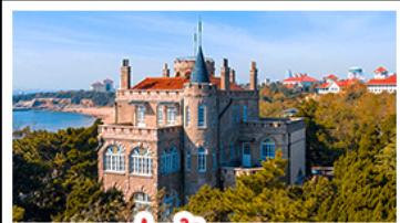
ป่าด้ากวน

พระราชวังฤดูร้อน - วิวเมืองชิงเต่า รถไฟความเร็วสูง - ภูเขาเหลาซาน กำแพงเมืองจีนด่านจวิยงกวน - ป่าด้ากวน พักโรงแรมระดับ 4 ดาว - ไม่หลงร้านช้อปปิ้ง มือพิเศษ เปิดปักกิ่ง , หม้อไฟซีฟู้ด