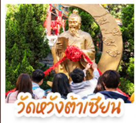
วัดเข่งต้าเซียน