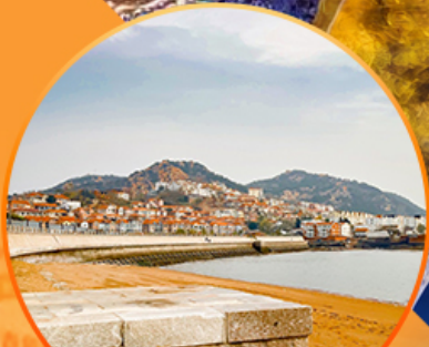
ซาจื่อโป๋