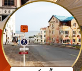
ถนนฮั่วจวีป่า