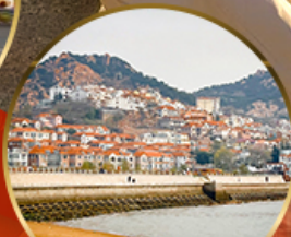
ซาจื่อโข่