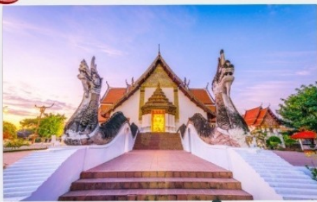
วัดภุมรินทร์